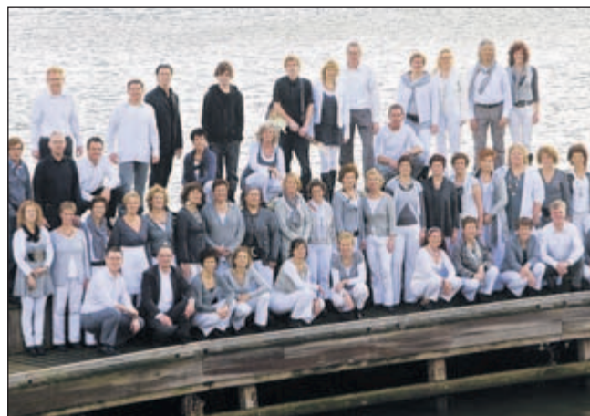
Het Cuijke popkoor Noisy Voices.

Noisy Voices treedt regelmatig op in Cuijk en omgeving. Het koor werkt soms samen met andere muziekgezelschappen om voor de luisteraars het maximale uit de muziek te halen. Onlangs werd met harmonie Irene uit Beers opgetreden en daarvoor ook met Gaudete in Domino uit Cuijk. Ook levert het koor